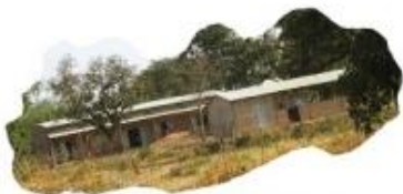
Scuola media (CE6) di Monkara