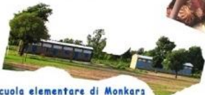
Scuola elementare di Monkara

Destina il tuo 5 x 1000 dell'imposta sul reddito delle persone fisiche a