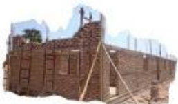
Nuova scuola in costruzione a Matekaga

Puoi aiutarci anche dando un piccolo contributo di tempo per le varie iniziative che vengono proposte!