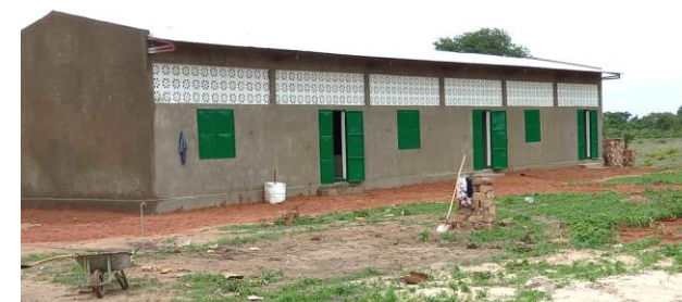
La nuova scuola di Matekaga (2021)

I fondi raccolti attraverso queste attività sono interamente destinati al sostegno di tutti i progetti.